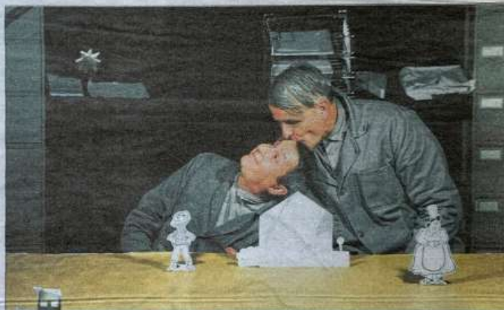
Dans un Océan d'Amour , les deux comédiens ont transporté le public dans une odyssée poétique.

Bientôt, le tableau laisse place à un duo comique. L'un s'applique quand l'autre fait le sagouin, mué davantage par son excitation que par l'envie de bâcler. Qui aurait