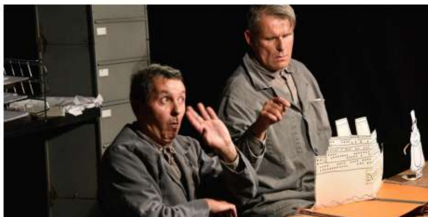
Une histoire racontée par des gestes et de la manipulation d'objets.

Par Chantal Gibert Publié le 06/07/2022 à 20h57