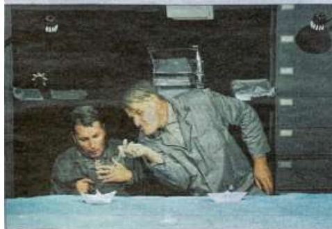
La Salamandre proposait une aventure à la recherche de l'être aimé disparu.