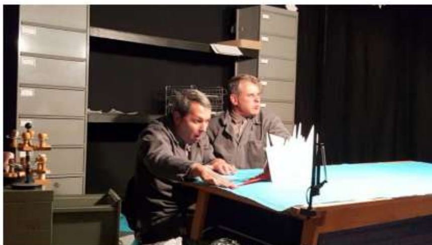
Deux manipulateurs d'objets très expressifs.